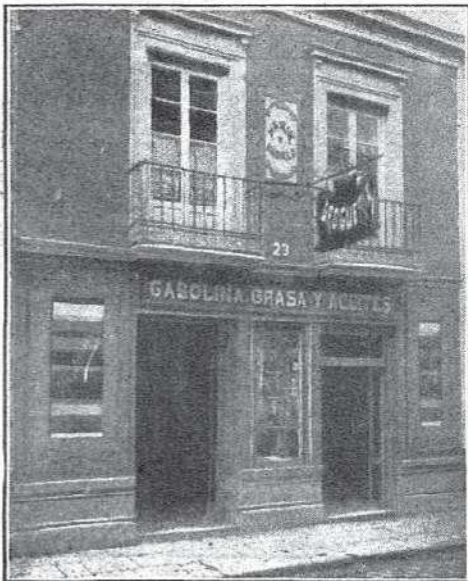
Sucursal en Carrera de Espinel, núm. 23, dedicada á la venta de Drogas y Perfumería