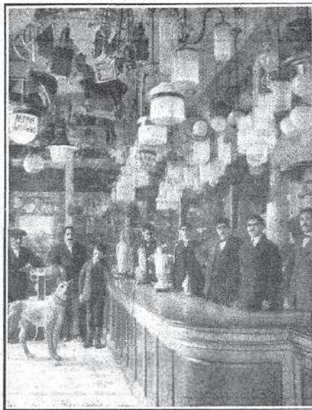
Casa central dedicada al Comercio de Paquetería, Quincalla, Bisutería y Artículos para Instalaciones eléctricas y telefónicas