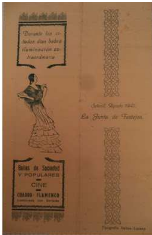
FOLLETO DE 1947 Y 1951.